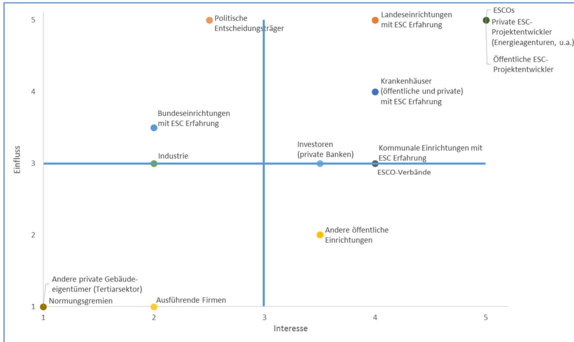
Abbildung 2 Stakeholder-Analyse - Einfluss und Interesse

Aus obiger Tabelle bzw. Abbildung kann man ablesen, dass das höchste Einflusspotenzials und größte Interesse bei folgenden Stakeholdern liegt (= Keyplayer neben den Contractoren):