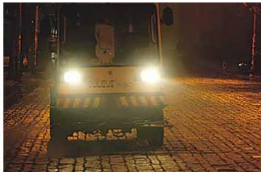
Projecto vai custar quase 40 milhões de euros e deve avançar este ano

“Um outro projecto europeu, designado Changebest, permitiu concluir que não há confiança entre a empresa de serviços de energia e o cliente. É essa barreira do mercado que queremos tentar combater”,